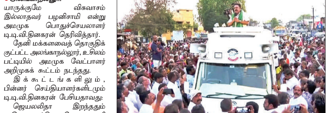
உசிலம்பட்டி அருகே நடுப்படியில் பிரச்சாரத்தில் ஈடுபட்ட தேனி தொகுதி அமமுக வேட்பாளர் டி.டி.வி.தினகரன்.

அமமுக பொதுச்செயலாளர் டி.டி.வி.தினகரன் கருத்து