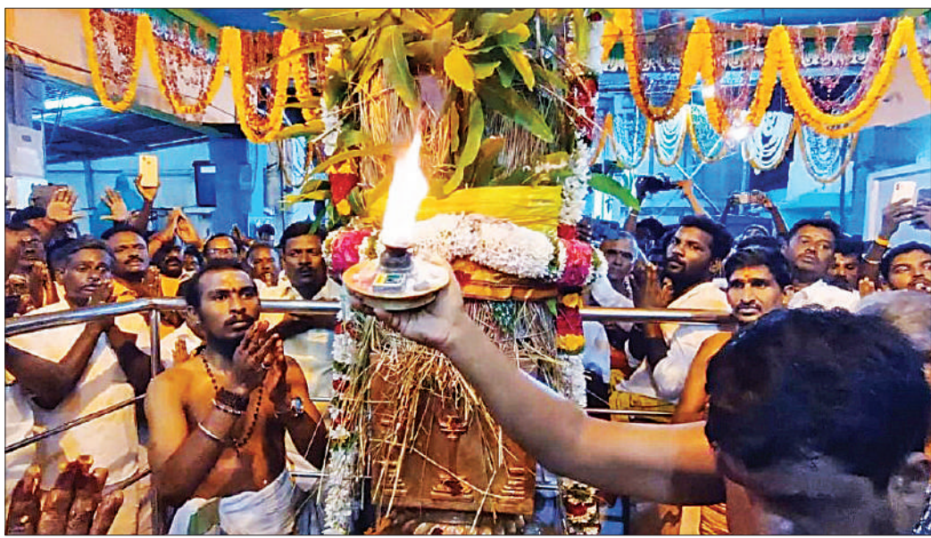
தாயமங்கலம் முத்துமாரியம்மன் கோயில் பங்குனி திருவிழா கொடியேற்றத்தின்போது கொடியேற்றத்துக்கு நடத்தப்பட்ட தீபாராதனை. (வலது) சிறப்பு அலங்காரத்தில் எழுந்தருளிய அம்மன்.