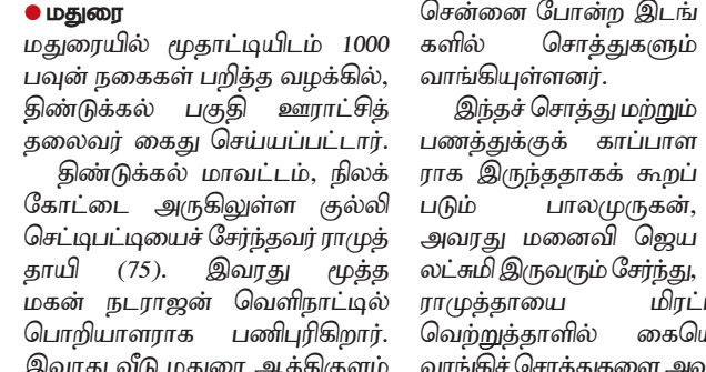
மதுரை மாவட்டத்தில் மதுரைக்கு குற்றம்சாட்டுவதில் ஈடுபட்ட தலைவரின் கைது.

மதுரை மாவட்டத்தில் மதுரைக்கு குற்றம்சாட்டுவதில் ஈடுபட்ட தலைவரின் கைது. மதுரை மாவட்டத்தில் மதுரைக்கு குற்றம்சாட்டுவதில் ஈடுபட்ட தலைவரின் கைது. மதுரை மாவட்டத்தில் மதுரைக்கு குற்றம்சாட்டுவதில் ஈடுபட்ட தலைவரின் கைது.